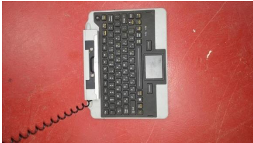
עמדת עגינה לטאבלט