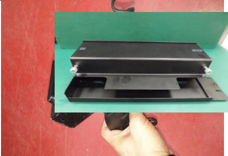
עמדת עגינה למדפסת הדס